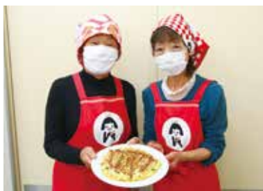
▲ご協力いただいた JA女性部四ツ子支部