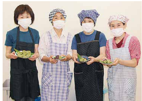
▲ご協力いただいたJA女性部 小栗田支部の皆さん