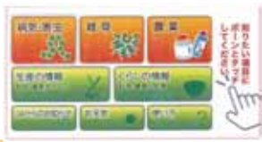
病害虫・雑草診断など簡単に操作できます!! 探したい項目を指でタッチ!!