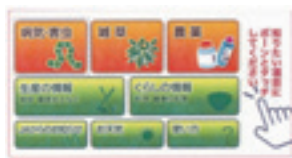
病害虫・雑草診断など簡単に操作できます!! 探したい項目を指でタッチ!!