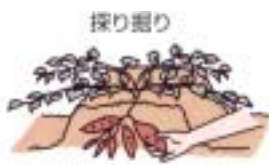
太った芋だけ収穫する