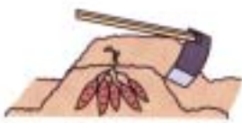
くわを大きく打ち込み株全体を掘り上げる