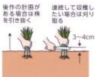
葉が20cmくらいに伸びたら収穫する